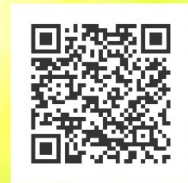
Alle Infos, Orte und Aktionen hier zum Scannen!