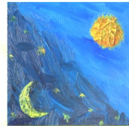
Himmelsgewölbe Kübenkapelle Belecke