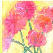
Ruhe KiTa St. Petrus Warstein