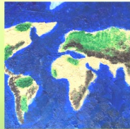
Lebewesen KiTa St. Antonius Allagen