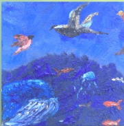
Fische und Vögel Renaturierung Wäster Warstein