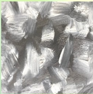
Es werde Licht KiTa St. Pankratius Belecke

Erlebnis-Stationen zur Schöpfungsgeschichte